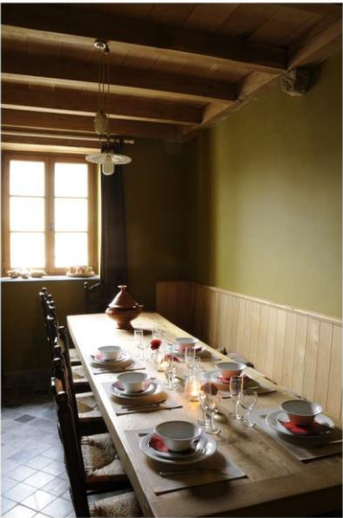
De grote gîte in Louppy-sur-Loison