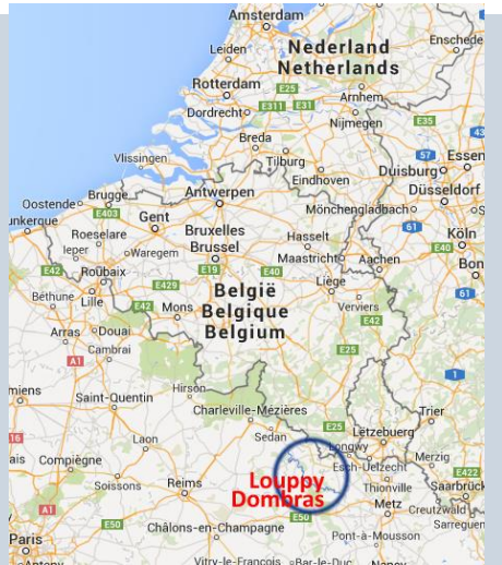
Louppy - Dombras Département Meuse, Noord-Frankrijk